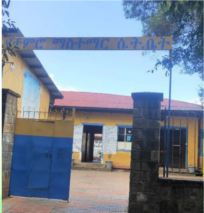
በምስካይ ገዛናን መድኃኔ ዓለም ገዳም ተምሮ ማስተማር ሰንበት ትምህርት ቤት

አቶ ከፈለኝ:- ሰንበት ትምህርት ቤቱ በብዙ ሺህ የሚቆጠሩ አባላት ያሉት ሲሆን አንድነትና ትስስራቸው ደግሞ ይበል የሚያስኝ ነው። በእድርና በተለያዩ አደረጃጀቶች ውስጥ በመሳተፍም የመረዳዳት ባህላቸውን ያጎለበቱ ናቸው። የአባላቱን አንድነት ለማጠናከርም መንፈሳዊ ጥማቸውን ለማርካት ተከታታይ የሰብከተ ወንጌል አገልግሎት ይሰጣል። በተጨማሪም በሰርግ፣ በለቅሶ በተለያዩ ማኅበራዊና ሃይማኖታዊ ጉዳዮች ላይ አባላት ከፍተኛ ተሳትፎ ያደርጋሉ። በንደኝነት በመንፈሳዊ አጋርነት ያላቸው መተሳሰብና ቁርኝት በጣም ከፍተኛ ነው። በውጭ ያሉ አባላት ከዚያው ከሚያደርጉት እንቅስቃሴ በተጨማሪ ሰንበት ትምህርት ቤቱንና ቤተ ክርስቲያንን በክህሎታቸው፣ በዕውቀታቸውና በገንዘባቸው እያገዙ ይገኛሉ።