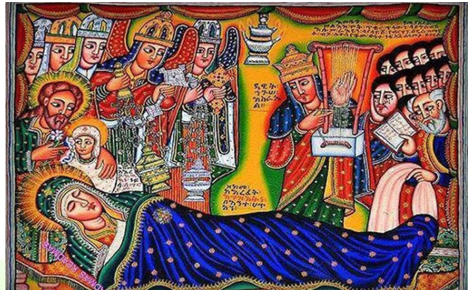
የእናታችን የቅድስት ድንግል ማርያም ዕረፍት

ሌላው ደግሞ ልጆች! በጥር ወር በታላቅ ድምቀት የሚከበር ታላቅ በዓል አለ። ይህ በዓል አስተርጓሚ ማርያም ወይም የእመቤታችን በዓለ ዕረፍት ይባላል። አስተርጓሚ ማርያም የተባለበት ምክንያት በዓሉ በጥር ወር ስለሚከበር ነው። ታዲያ ይህ በዓል የእናታችን የቅድስት ድንግል ማርያም ዕረፍትን ታሳቢ በማድረግ የምናከብረው በዓል ነው። የሚከበረው ደግሞ ጥር ፳፩ ቀን ነው። ከዚህ በታች እንደሚከተለው በዓሉ የሚከበረበትን ምክንያት እንማራለን ማለት ነው። በጥሙና ተከታተሉ።