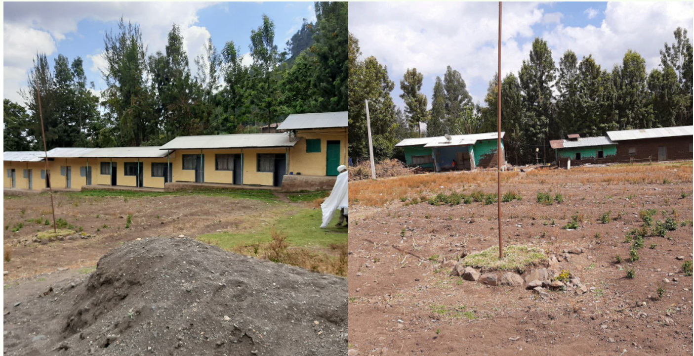
የቦር ሥላሴ ጉባኤ ቤት

ስምዐ ጽድቅ:- ሌሎች ደቀ መዛሙርት ጦርነቱን ፈርተው ሲሰደዱ እርስዎ በጉባኤ ቤቱ ለመቆየት እንዴት ወሰኑ? በዚህ ወቅት ለጉባኤ ቤቱ ድጋፍ እያደረገ ያለው ማን ነው? ደቀ መዛሙርቱ ትምህርታቸውን በጥሩ ሁኔታ እንዲከታተሉ የሚያስፈልጋቸው ምንድን ነው?