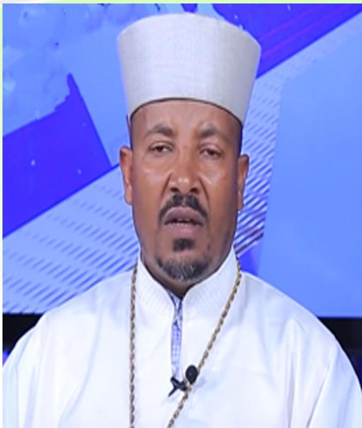
መልአክ ሕይወት ቀሲስ ንጉሤ አወቀ የሀድያ (ስልጤ ሀገረ ስብከት ሥራ አስኪያጅ)