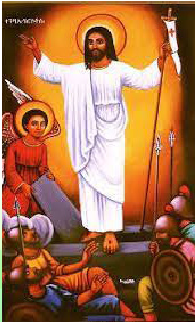
የጌታችንና የእምላካችን የኢየሱስ ክርስቶስ ዳግም ትንሣኤ

ልጆች! እንዴት ከረማችሁ? እንኳን ለዳግም ትንሣኤ በዓል በሰላም አደረሳችሁ! ልጆች በቤተ ክርስቲያናችን ሥርዓት ከትንሣኤ ጀምሮ እስከ በዓለ ጳጳሩ ለጠስ ድረስ ሰላምታ የምንለዋወጠው ከላይ በመግቢያው ላይ ባለው መሠረት ነው። ለዚያም ነው በዚያ ሰላምታ የጀመርነው። ልጆች እናንተም እስከ በዓለ ጳጳሩ ለጠስ ድረስ በዚህ መልኩ ሰላምታ መለዋወጥ አለባችሁ እሺ ልጆች!