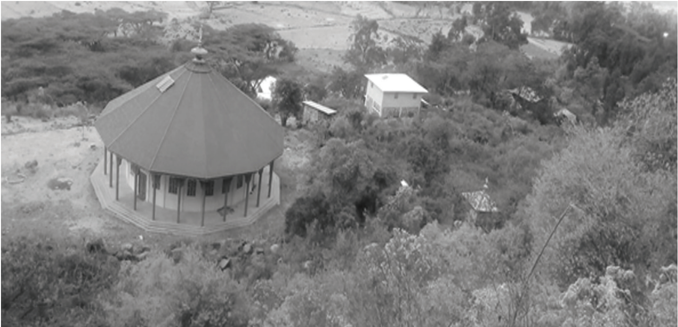
ከተራራው ሥር የተሠራውና የመድኃኔ ዓለም ጽላት የሚገኝበት ቤተ ክርስቲያን

በማጥናት ከጳጉሜ ፡፡፩ ዓ.ም ጀምሮ የወተት ልማቱ እንዲጠናከር ፕሮጀክት በመተግበር በጳጉሜ ፡፡፩ ዓ.ም አምስት ላሞችን፣ ጌጌ ቆርቆሮ ያለው የላሞች መጠለያ ቤት፣ ዕቃ ቤት እና ወተት ማስቀመጫ በመሥራት ልማቱ ተጠናክሮ እንዲቀጥል ሆኗል። ይህ የወተት ልማት ፕሮጀክት በገዳሙ ላሉት አብነት ተማሪዎች ድጎማ እና መነኩሳት መተዳደሪያ እንደ ተጨማሪ ገቢ በመሆን እያገለገለ ይገኛል። በመሆኑም በአሁኑ ሰዓት ገዳሙ ፲፮ የወተት