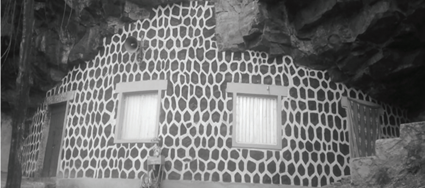
የቅዱስ ሩፋኤል ጽላት ያለበት ፍልፍል ዋሻ ቤተ ክርስቲያን

ከዚህ በተጨማሪም ከጳጉሜ ፡፡፩ ዓ.ም ጀምሮ የወተት ላም በመግዛትና ለአካባቢው ማጎበኘት ወተት በማቅረብ ገቢ ማግኘት ተችሏል። የወተት ላም ፕሮጀክቱን ማጎበኘት ቅዱሳን ዋናው ማእከል