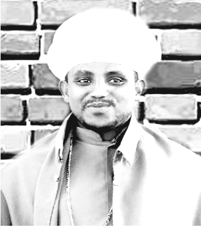
መጋቤ ሐዲስ ኤፍሬም

መጋቤ ሐዲስ ኤፍሬም :- ከብሉይ ኪዳን ጀምሮ ለአእምሮ የረቀቀውንና የራቀውን ጉዳይ የተሻለ ቅርብ እንዲሆን በምሳሌ ማስተማር የተለመደ ነው። ነቢዩ ዳዊት “ነገራን በምሳሌ እጅምራለሁ፤ ከቀድሞ ጀምሮ ያለውን ምሳሌ እናገራለሁ” (መዝ. ፸፯፡፪) በማለት እንደተናገረው ጌታችን መድኃኒታችን ኢየሱስ ክርስቶስም በተግባር ያከናወነውንም ሆነ በቃል ያስተማረውን ትምህርት በምሳሌ ገልጾታል። እንደዚህ ሁሉ መንፈስ ቅዱስ በእሳት አምሳል የወረደበት ምክንያት ምንም እንኳን ምሳሌው የማይተካከል ቢሆንም መንፈስ ቅዱስ የሚያከናውናቸው ተግባራት ከእሳት ተግባራት ጋር የሚያመሳስሉ ጉዳዮች ስላሉት የበለጠ ለአእምሮ ቅርብ ለማድረግ ነው። የሚያመሳስላቸውን ጉዳይ ለመመልከት ያህል፡-