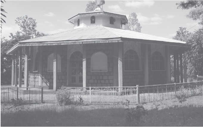
የጦመ ግራር ምዕራፈ ቅዱሳን አቡነ ተክለ ሃይማኖት አንድነት ገዳም

መነኩሳቱ ይናገራሉ። ለጸድቁ አቡነ ተክለ ሃይማኖት ከሰማይ የወረደላቸው መስቀል ከቦታው ወደ ደብረ ሊባኖስ ከተወሰደ በኋላ ብዙ ነገሮች እየቀነሱ መምጣታቸውንም ይገልጻሉ። የመነኩሳቱ ቍጥር መቀነስ፣ እንደ አጠቃላይ በአካባቢውም የምእመናን ቍጥር መቀነስና የሌላ እምነት ተከታዮች ቍጥር እየጨመረ፣ የቦታው ዕውቅናም እየተቀዛቀዘ መምጣት ከመስቀሉ ወደ ደብረ ሊባኖስ መሄድ በኋላ እንደ ሆነ የጥንት አባቶችና ታሪክ አዋቂዎች ይናገራሉ።