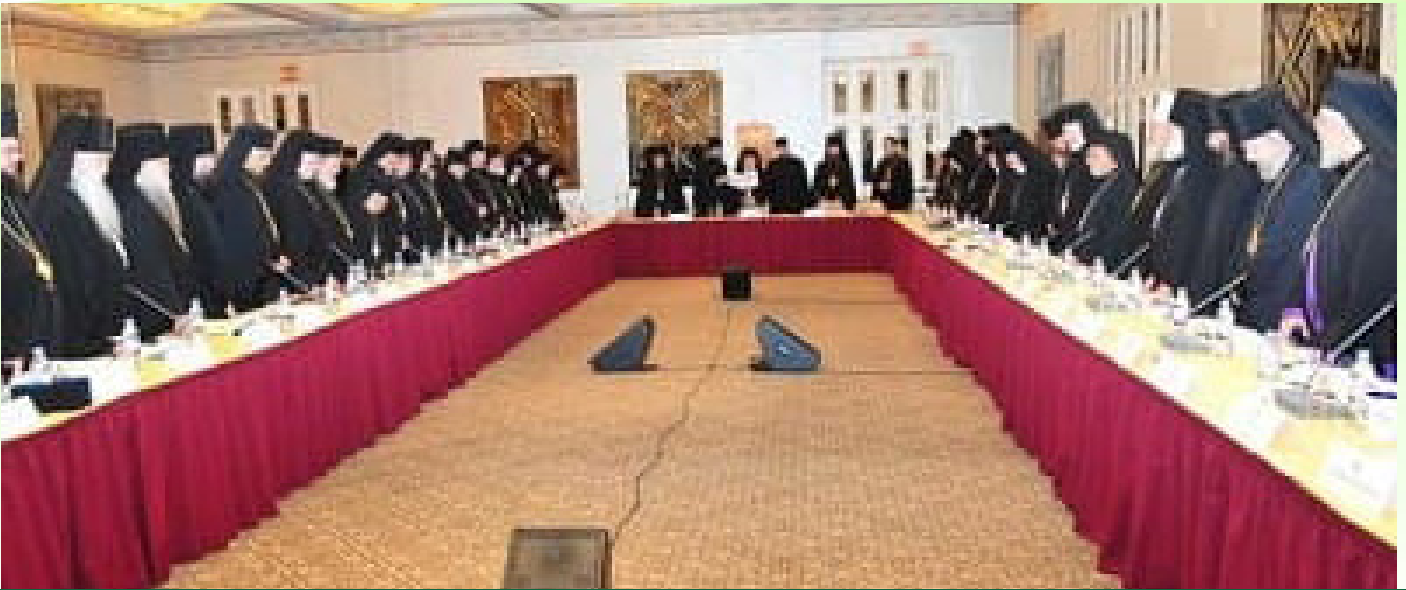
የአሜሪካ ኦርቶዶክሳውያን ጳጳሳት ኅብረት አባላት