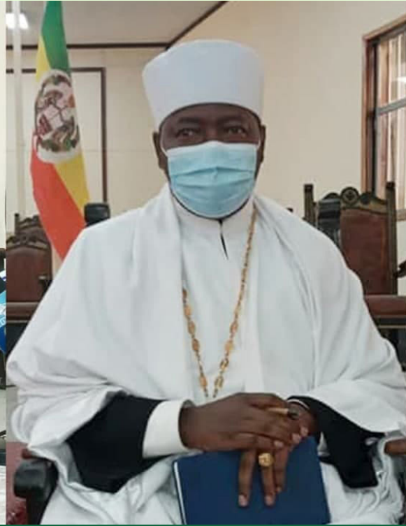
ሊቀ አእላፍ ቀሲስ በላይ መኩንን

ክልል ያለችው ቤተ ክርስቲያን አገልግሎት መዳከም ያሳስባቸው ወገኖች ችግሩን ለመፍታት ሲሉ «የኦሮምያ ቤተ ክህነትን» ለማቋቋም እንቅስቃሴ ሲያደርጉ እንደቆዩ በመግለጫው ተነስቷል።