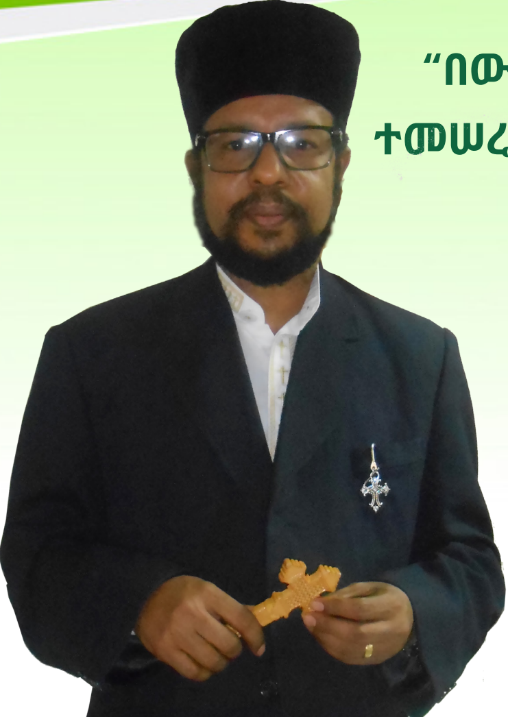
መልአክ ገነት በለጠ ይረፉ