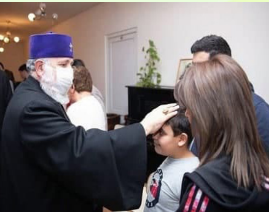
ብጹዕ ወቅዱስ አቡነ ካራኪን ዳግማዊ

የአርመንያ ኦርቶዶክስ ቤተ ክርስቲያን ለተፈናቃዮች የምግብ፣ የልብስና ሌሎች አስፈላጊ ድጋፎችን እያደረገች ሲሆን ተጨማሪ ርዳታ ማድረግ የሚፈልግ ማንኛውም አካል ካለ ደግሞ «የእችላለሁትን ጎደኞች» በሚለው አድራሻ በኩል ድጋፍ ማድረግ እንደሚቻል ከዘገባው ለመረዳት ተችሏል።