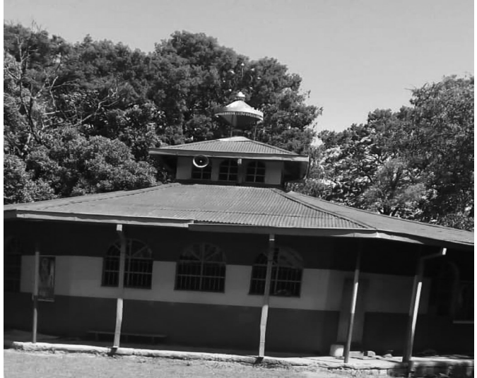
የሐዋርያ ቤተ ክርስቲያን

ካህንና አንድ ዲያቆን ተቀብለው ተመልሰው ስድስት ወር ፈጅቶባቸው በዓመታቸው ከቤታቸው ገቡ። እንደተመለሱም መቃኛ ሠርተው ያመጡትን ታቦት አስገቡ።