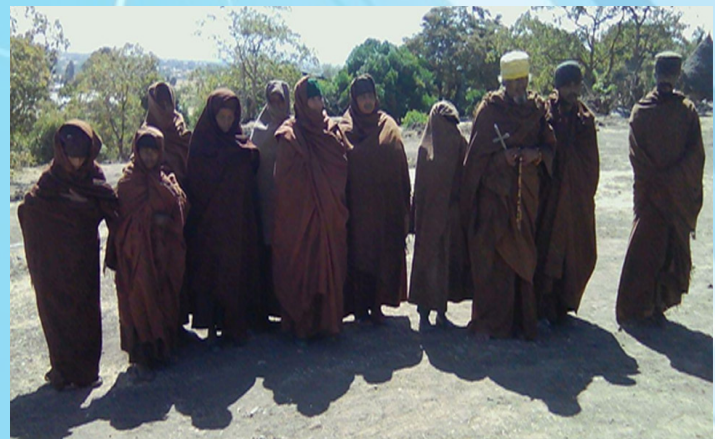
የገዳሙ መናንያን እና አለባበስ በከፊል

በገዳሙ መናንያን ከሰኞ እስከ ዓርብ በሁለት ቀን አንድ ጊዜ በ፱ ሰዓት፣ ቅዳሜ እና እሁድ በ፫ ሰዓት አንድ ዳቤ የሚሰጣቸው ሲሆን፣ በሥራ ላይ ለሚሰማሩት ግን በየቀኑ ምሳ ላይ እንጀራ ይሰጣቸዋል። ከዚህ በተጨማሪ ለአብነት ተማሪዎች በቀን ሁለት ጊዜ እንጀራ ይሰጣቸዋል። መናንያኑ የሚለብሱት ሁሉም አንድ አይነት የሆነ እና በገዳሙ መናንያን ከቅጠላቅጠል በሚዘጋጅ ቀለም የሚነከር ቀይ ቡኒ ቀለም ያለው አቡጁዲ ሲሆን፣ አስፋፋም የገዳማውያንን ሥርዓት የተከተለ ነው።