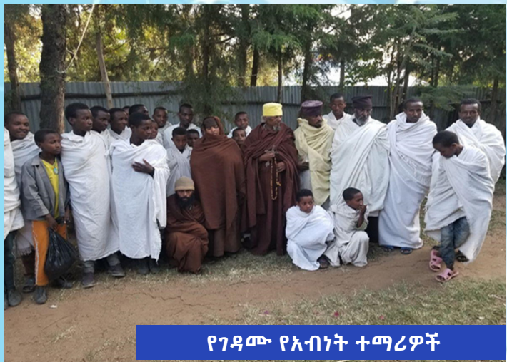
የገዳሙ የአብነት ተማሪዎች

አንዳንድ የማኅበሩ አባላት የተሟላ ገዳማዊ ጠባይ እንዲኖረው ቅዳሜና እሑድ እንዲሁም በየዓመት በዓሉ ስብከተ ወንጌልና የመጻሕፍተ መነኩሳት ትምህርት በገዳሙ ውስጥ እንዲሰጥ ይደረጋል።