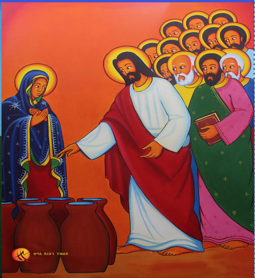
ሠዓሊ ዘረሁን ገ/ወልድ