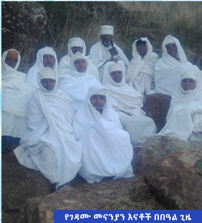
የገዳሙ መናንያን እናቶች በበዓል ጊዜ