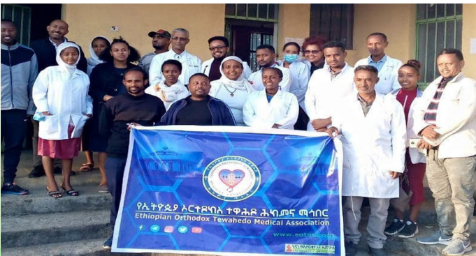
ድጋፍ ያደረጉ የማኅበሩ አባላት በከፊል