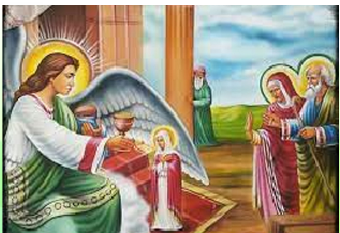
መልአኩ ቅዱስ ፋኑኤል ማርያምን ሲመግባት

በመጨረሻም ዘካርያስ “የእግዚአብሔር ሥራ አይታወቅም፤ ሁል ጊዜ ድንቅ ነው፤ ስለዚህ ምን አልባት መልአኩ የመጣው ለዚች ሕፃን ይሆናልና ይዘሻት ቀረብ በይ” አላት። ሐናም ሕፃኗን ማርያምን