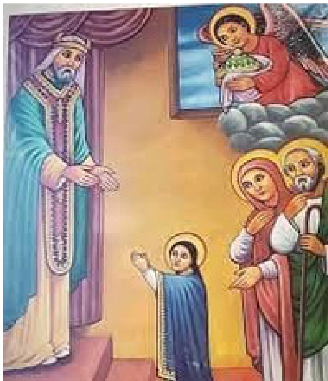
እመቤታችን ማርያም ወደ ቤተ መቅደስ እንደገባች

ልጆች! በዓታ ለማርያም ከእመቤታችን ከቅድስት ድንግል ማርያም ፴፫ (ሠላሳ ሦስት) በዓላት መካከል አንዱ ሲሆን የሚከበረውም ደግሞ ታኅሣሥ ሦስት