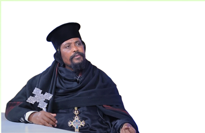
ቆሞስ አባ ጽጌሥላሴ መዝገቡ