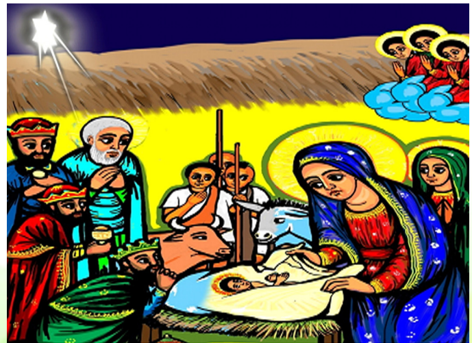
ጌታችን መድኃኒታችን ኢየሱስ ክርስቶስ እንደተወለደ

ልጆች! የገና ጨዋታ ተጫውታችሁ ታውቃላችሁ? የገና ጨዋታ ከጌታችን ልደት በዓል ጋር ተያይዞ የሚዘወተር የጨዋታ ዓይነት ነው። ቀደም ባለው ጊዜ የገናን ጨዋታ የሚጫወቱት እረኞች ብቻ ነበሩ ይባላል። ይህም እረኞች ጌታችን ሲወለድ ከሁሉም ቀድመው በማየት ከመላእክት ጋር የደስታ መዝሙር ስላቀረቡ እና በጌታ መወለድ ደስ ስለተሰኙ ነው።