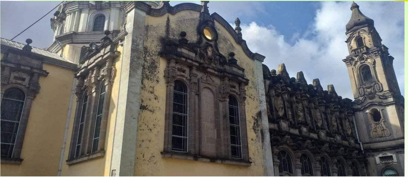
በዘመን ብዛት ያረጀው የካቴድራል ከፊል ገጽታ