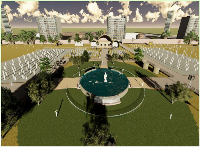
ግንባታው የተጀመረው የጃንሜዳ ታቦት ማደሪያ የወደፊት ገጽታ

አያይዘውም “ከዚህ በፊት የገንዳው ቅርጽ ዐራት መዓዘን የነበረ እና የባሕረ ጥምቀቱ አቀማመጥ ወደ ደቡብ አቅጣጫ የዞረ ነበር። በዚህ ግንባታ ግን ገንዳውን ወደ ክብ ቅርጽ፣ ባሕረ ጥምቀቱን ደግሞ ወደ ምሥራቅ አቅጣጫ ለውጥ በማድረግ እየተከናወነ ነው” ያሉት የሕዝብ ግንኙነት ኃላፊው በተጨማሪም የጥምቀት በዓል ካለው ሃይማኖታዊ ፋይዳ ባሻገር በማይዳሰስ የዓለም ቅርስነት የተመዘገበ እንደመሆኑ መጠን የማክበሪያ ሥፍራው ውበቱ የተጠበቀ እንዲሆን፣ ካህነትና ምእመናን እንዲሁም ሌላው የበዓሉ ታዳሚ ሁሉ ሥርዓተ ዑደቱን ሳይጨናነቅ