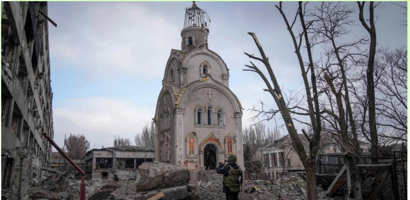
በጦርነቱ ወቅት የወደመ ሕንፃ ቤተ መቅደስ