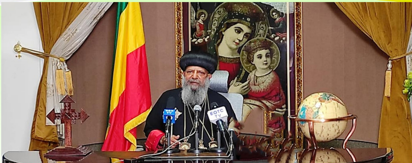
ብፁዕ ወቅዱስ አቡነ ማጉያስ