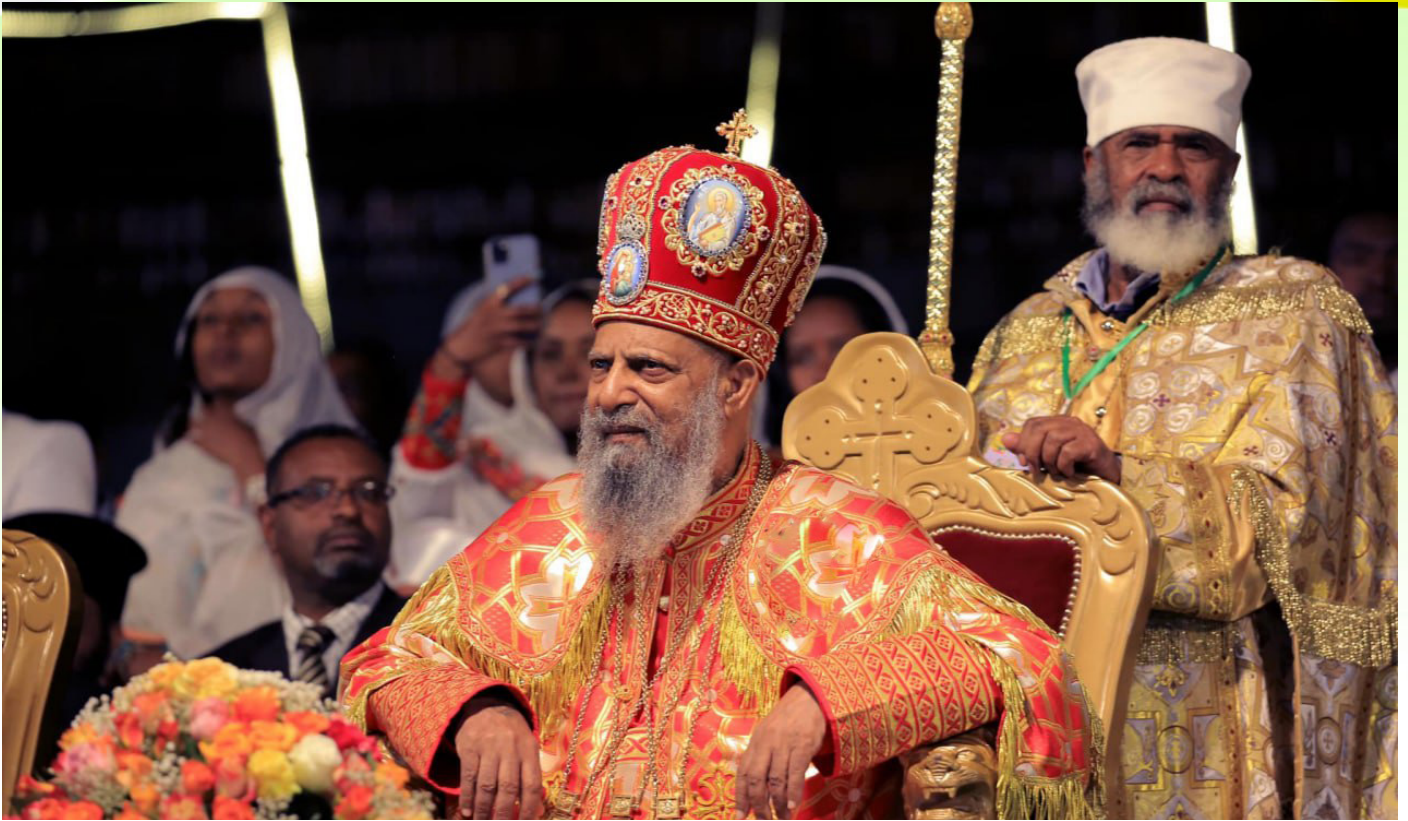
ብፁዕ ወቅዱስ አቡነ ማጉያስ