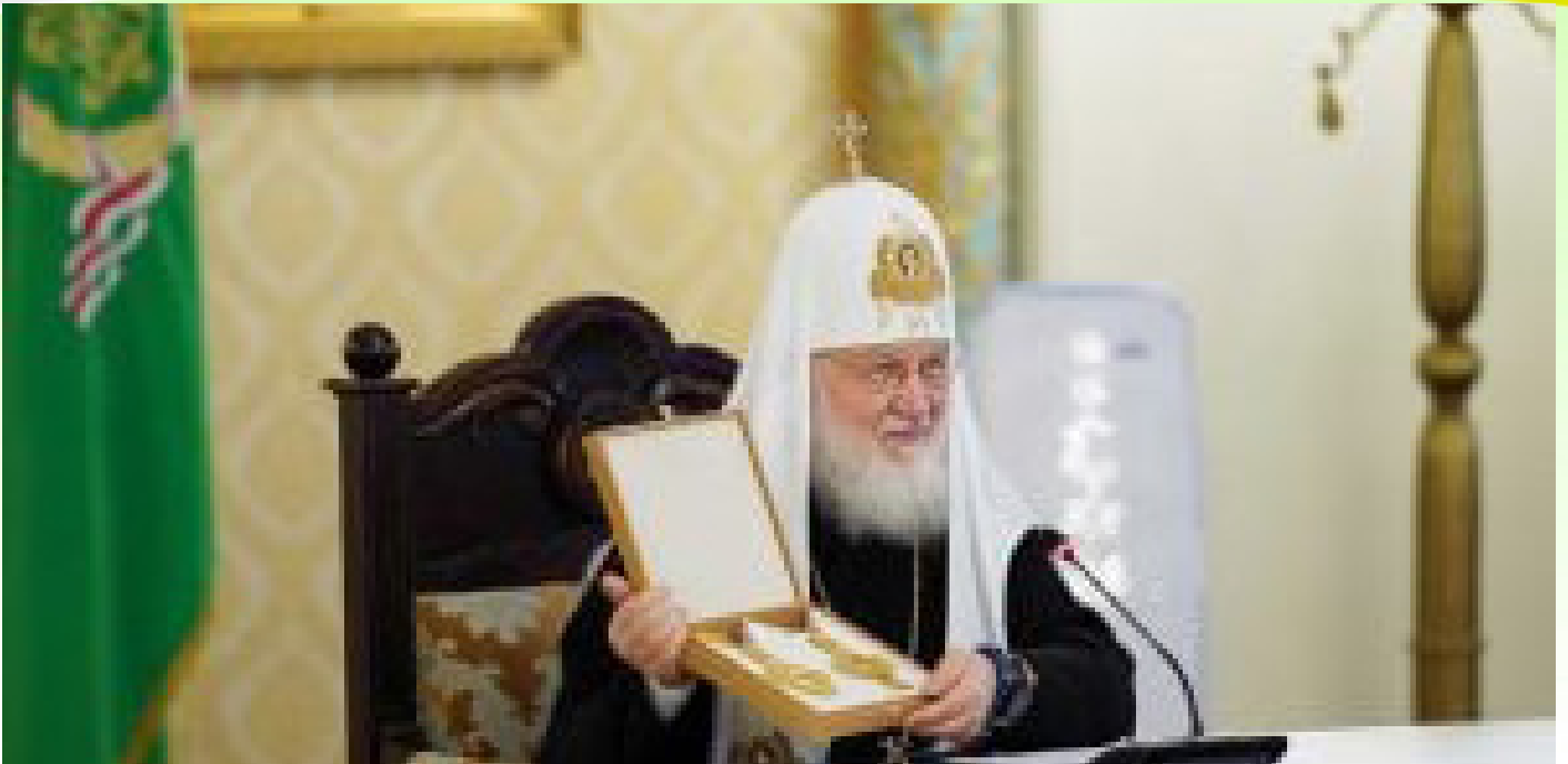
ብፁዕ ወቅዱስ አቡነ ኪሬል