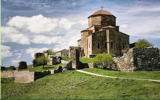
የጆርጂያ ጆሻሪ ገዳም

የረጅም ጊዜና ዘመን ተሻጋሪ ሆነው መገኘታቸው ለመከላከልና ዘመን የጆርጂያ ኦርቶዶክስ ቤተ ክርስቲያን ህያው ምስክሮች ሆነዋል ተብሏል።