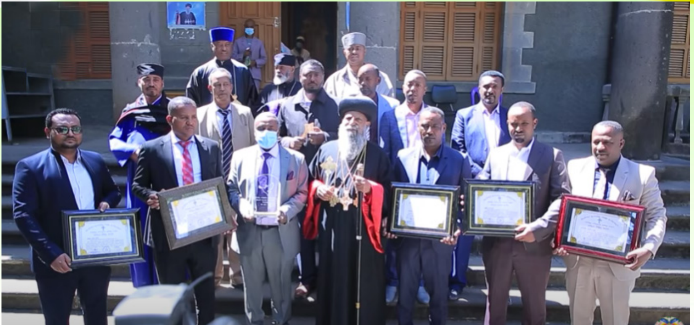
ቅዱስ ፓትርያርኩ ከድሬደዋ ከተማ አስተዳደር ካቢኔ አባላት ጋር