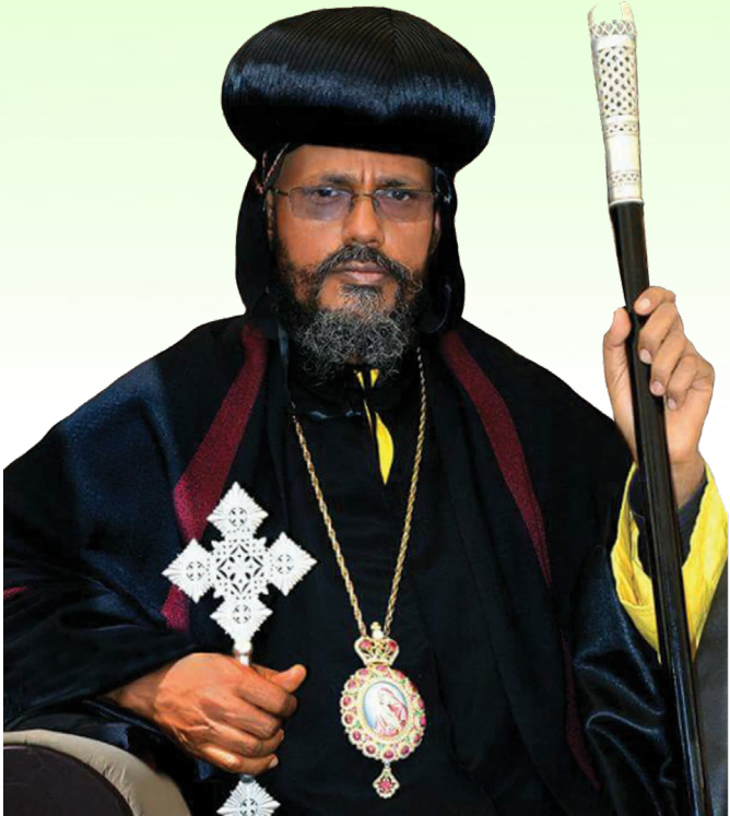
ብፁዕ አቡነ አብርሃም (የባሕር ዳር ሀገረ ስብከት ሊቀ ጳጳስ)